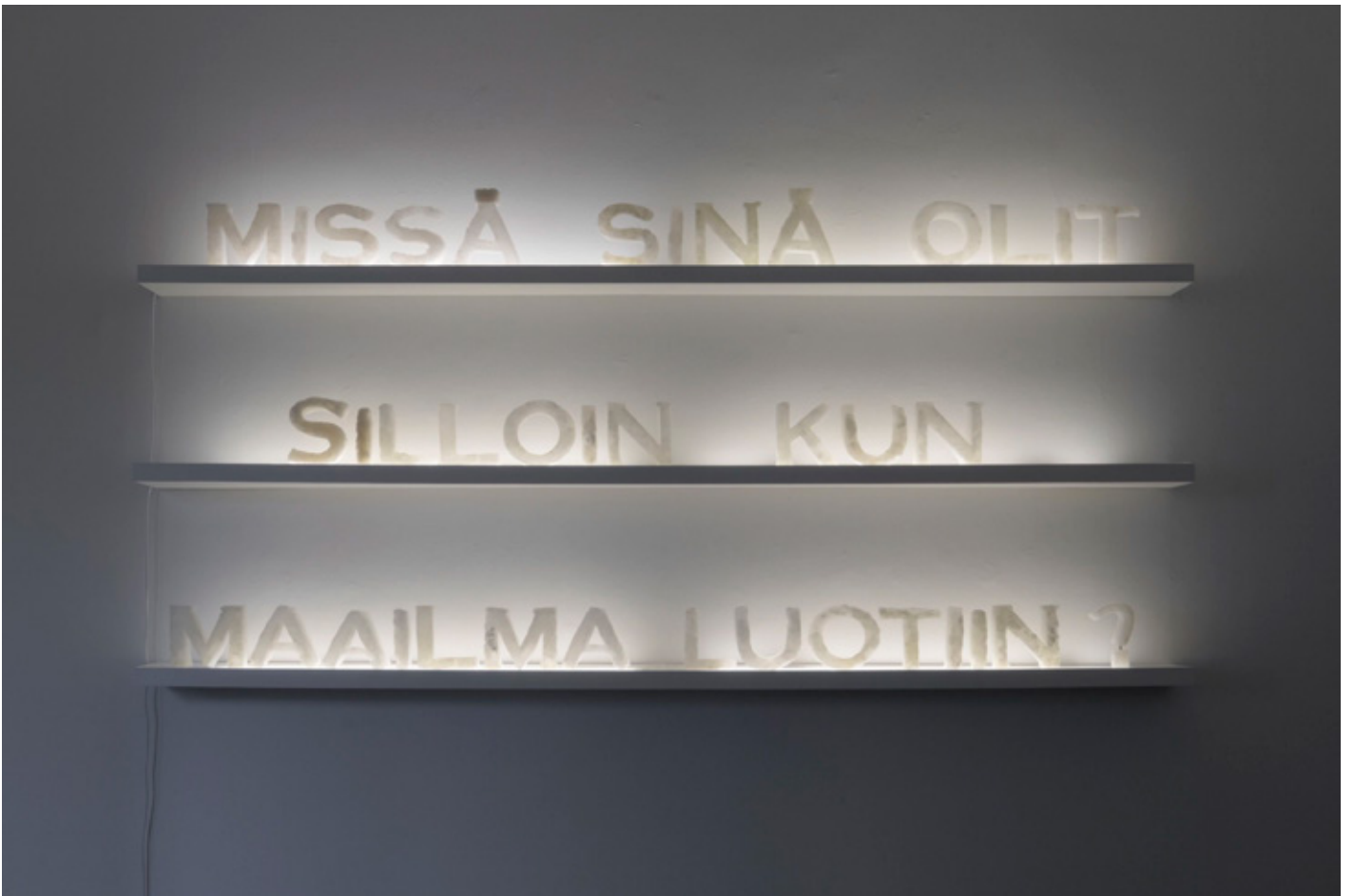
MISSÄ SINÄ OLIT SILLOIN KUN MAAILMA LUOTIIN?, 2016 lintujen nokkimista talikirjaimista valetut kopiot parafiiniin, vaneri, valo 3 x 23 x 280 x 17 cm