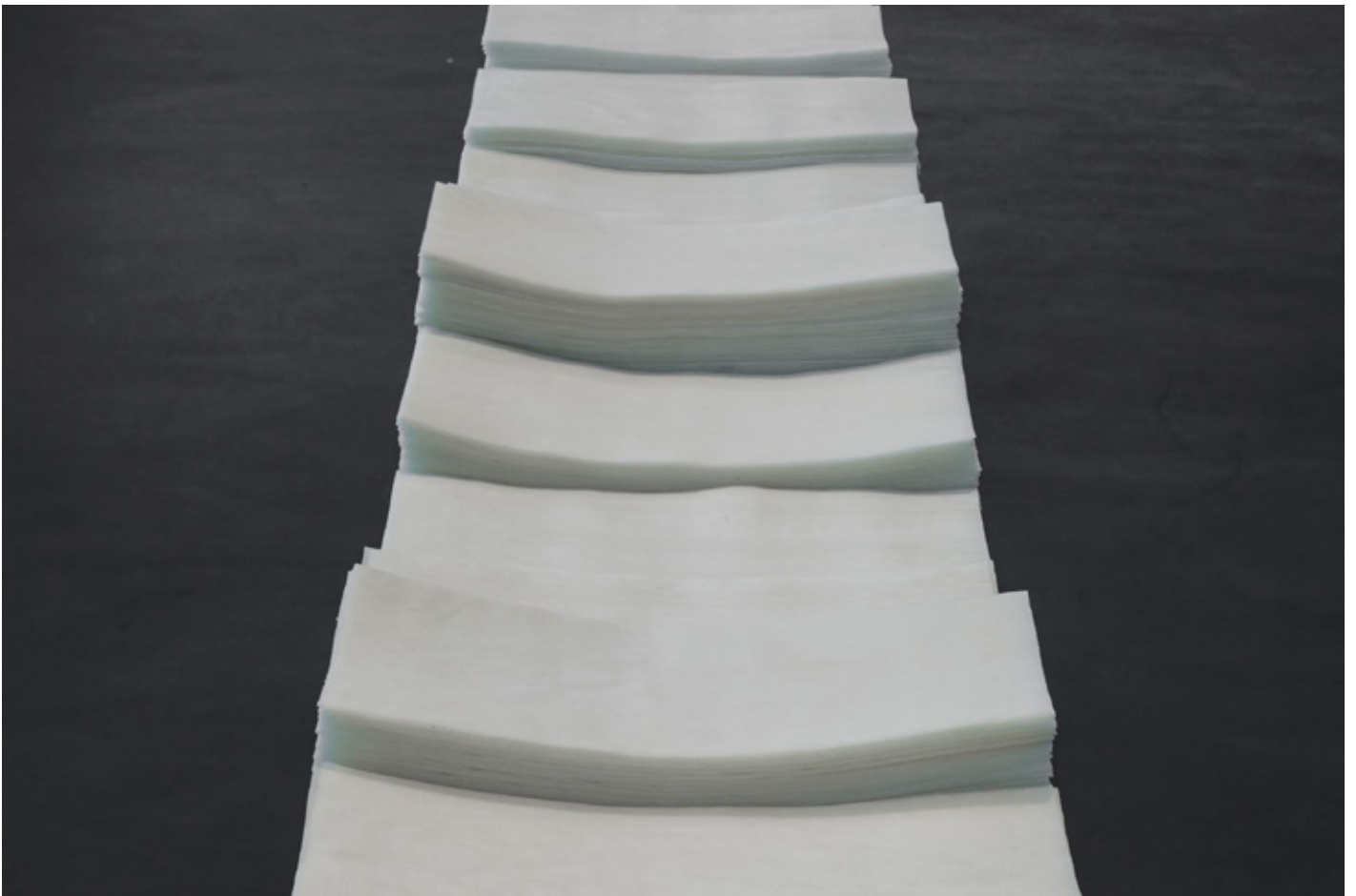
MITEN HISTORIAA LUETAAN?, 2016 käsinvaletut mehiläisvaha-arkit, metalli 124 x 1050 x 42 cm