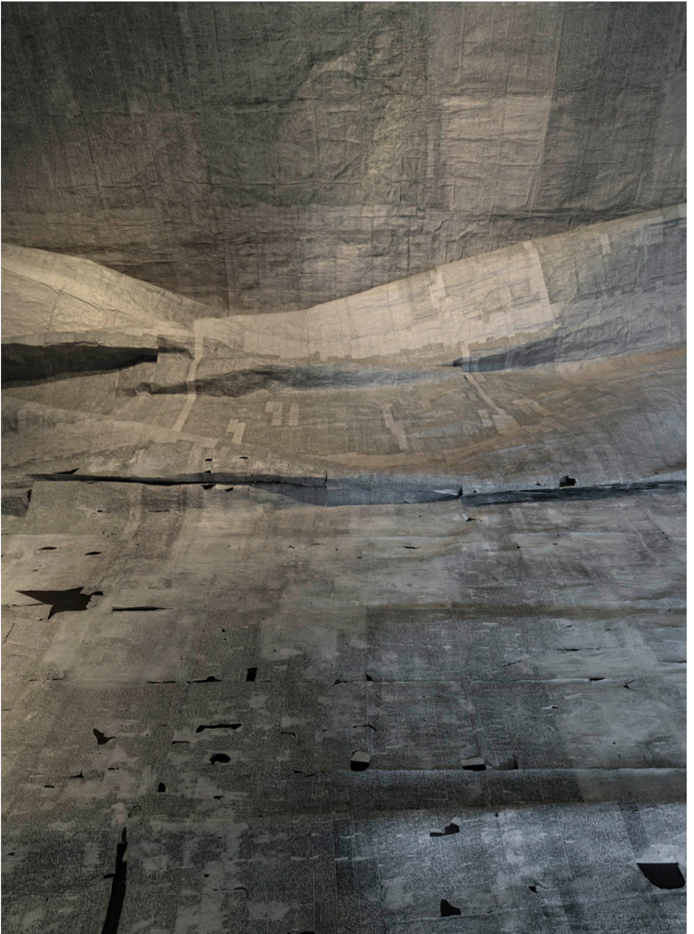
VALLOITTAJAN MERKINTÖJÄ, 2. PAINOS, 2016 muste, paperi, hiekkapuhallus 900 x 460 cm